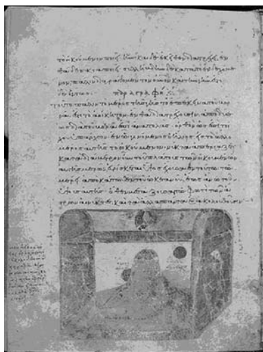
Слика 2. Страница из „Хришћанске космологије“ са цртежом Козминог модела универзума.

У суштини, Козма је предани јеретички (Несторијански) хришћанин, који је изузетно одан одбрани једноставне космологије јеврејске традиције. Комбинујући своја емпиријска географска посматрања са извесним библијским референцама, усваја, супротно тада прихваћеном Птоlemeјевом систему да облик Земље није сферни него раван, дугачак и узак, као шатор, кућа за молитву, коју је Мојсију описао Бог, за време јеврејског егзодуса из Египта. Другим речима, према Козми, Земља је равна правоугаона област – правоугаони паралелограм. Слично, Универзум је двоспратна, правоугаона, паралелопипедна кутија простране запремине, слична Заветном ковчегу, којој је Земља прва основица а „прво (највише) небо“ покривач. То небо је Небеско краљевство и стоји изнад небеског свода. Он чини „друго небо“, смртника, односно Земаљско краљевство. У основи, то је веровање укорењено у старој египатској космогонији. Цео систем се подржава на своје четири ивице, стубовима који се налазе на четири „угла Земље“, што је, као што смо већ поменули, према Козми раван паралелограм покривен небес-