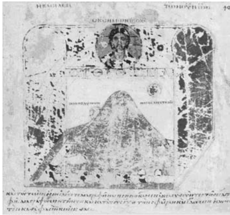
Слика 3. Два цртежа Козминој космолошкој модела.

гово време; то нису прихватили ни византијски учени људи, ни образовани хришћански свештеници.